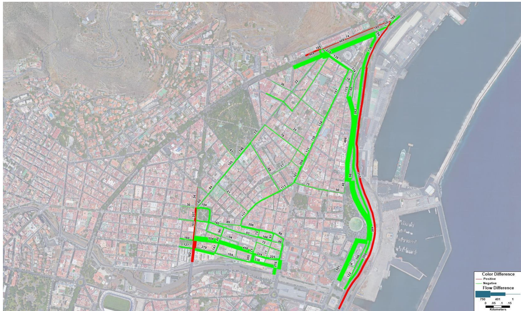
Figura 3. Flujo (veh/h) resultante en el modelo de la HPT para la Hipótesis futura