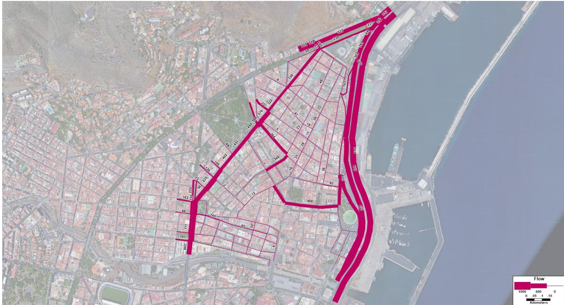
Figura 4. Flujo (veh/h) resultante en el modelo de la HV para la Hipótesis futura