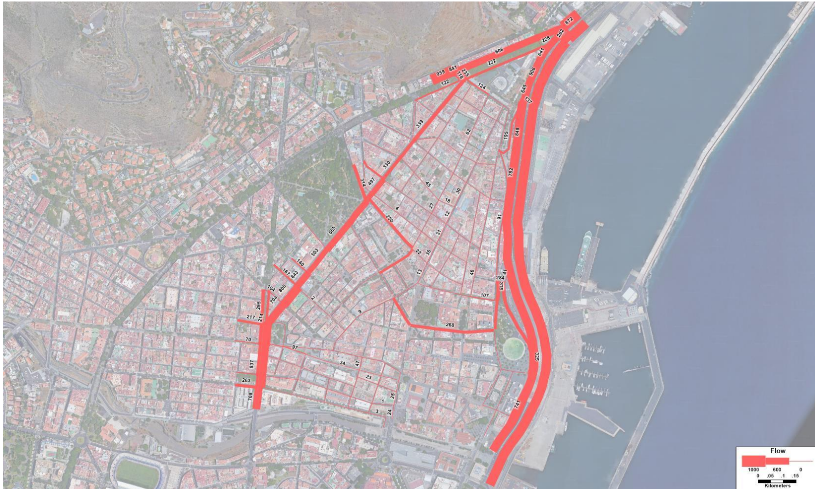
Figura 1. Flujo (veh/h) resultante en el modelo de la HPM para la Hipótesis futura