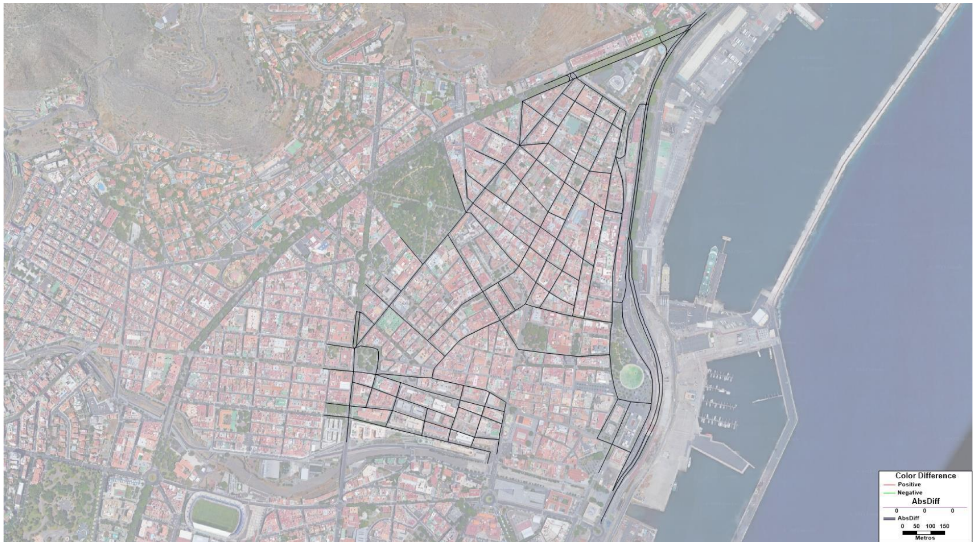
Figura 7. Flujo (veh/h) resultante en el modelo del Resto de Horas para la Hipótesis futura