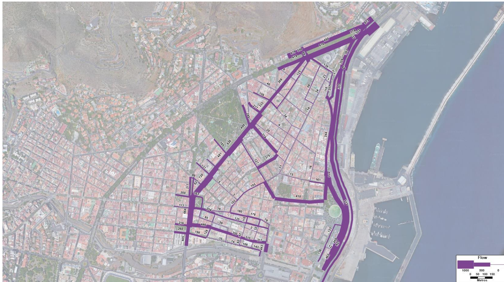
Figura 6. Flujo (veh/h) resultante en el modelo del Resto de Horas para la Hipótesis futura