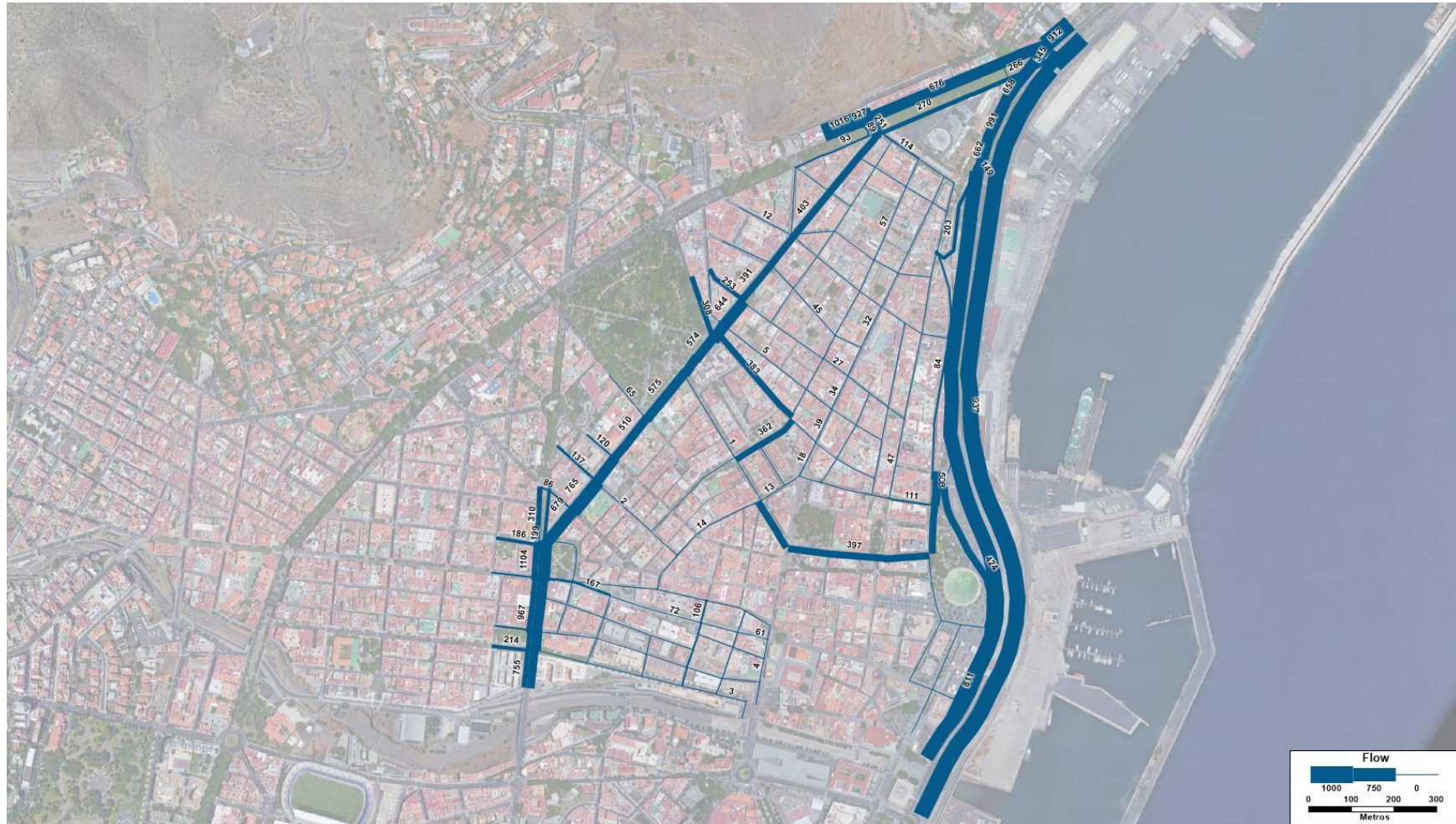
Figura 2. Flujo (veh/h) resultante en el modelo de la HPT para la Hipótesis futura