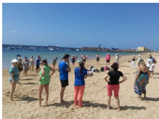
La actividad física en la playa tiene múltiples beneficios para la salud.