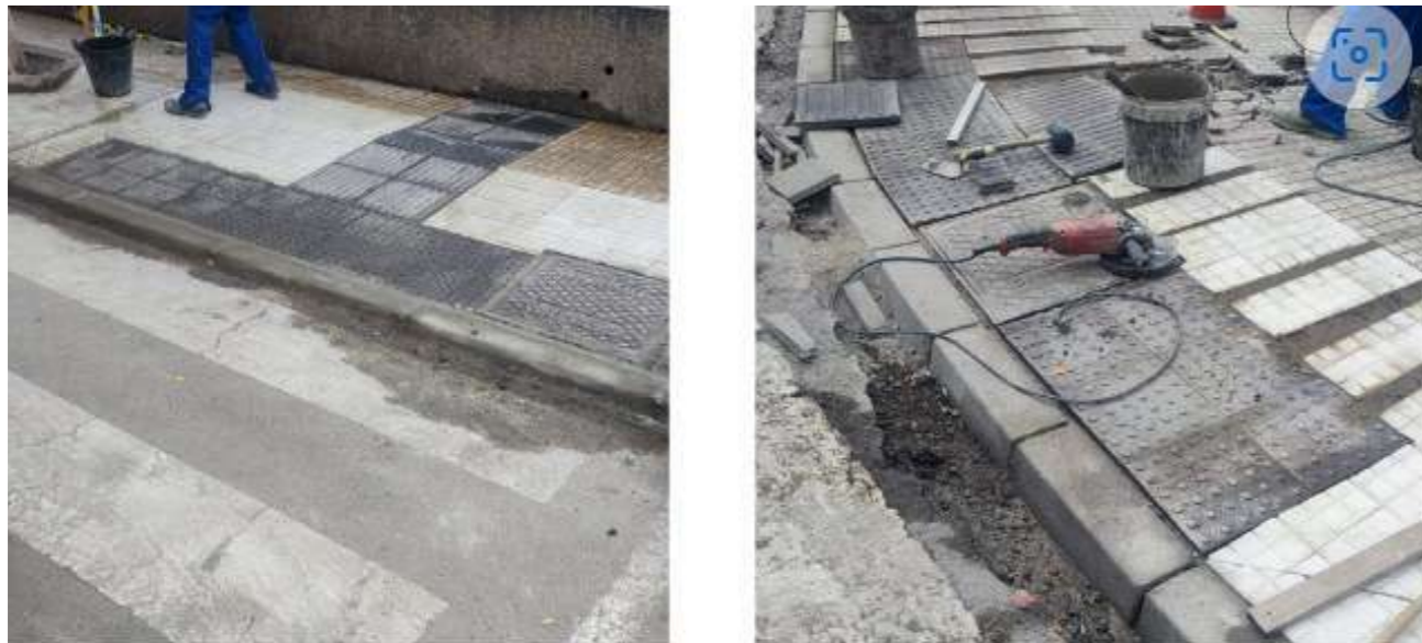
Proyecto en ejecución de la iniciativa 'Rebaje de Acera de José Zarate y Penichet'

En el año 2022 se realizaron las propuestas y en los meses de junio y julio de 2023 participaron en las votaciones de las iniciativas.