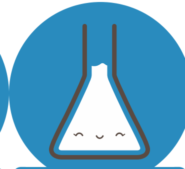
Física y Química