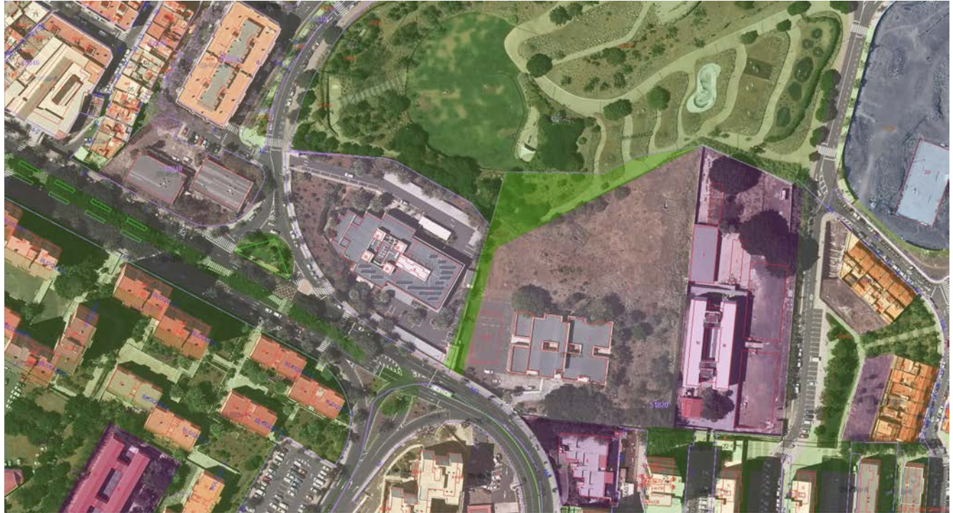
IMAGEN GENERAL DEL ÁMBITO