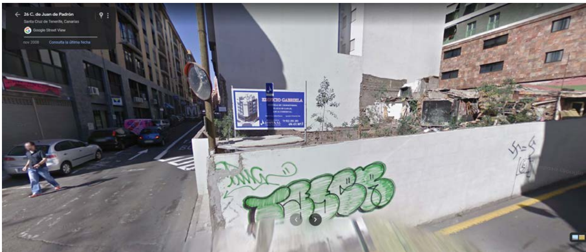
Foto Noviembre de 2008