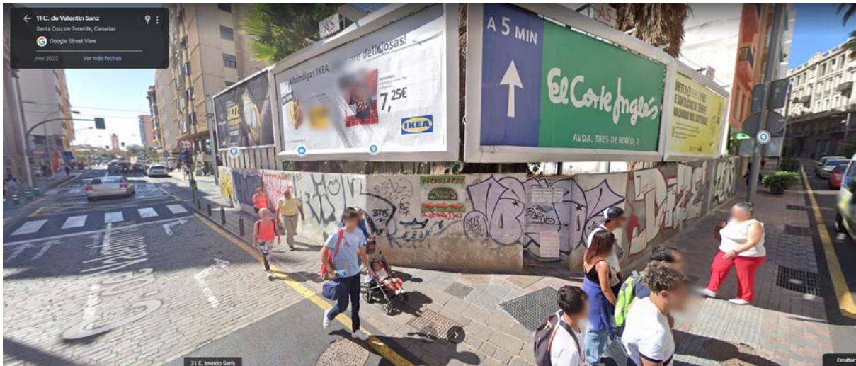
Foto de Noviembre de 2022