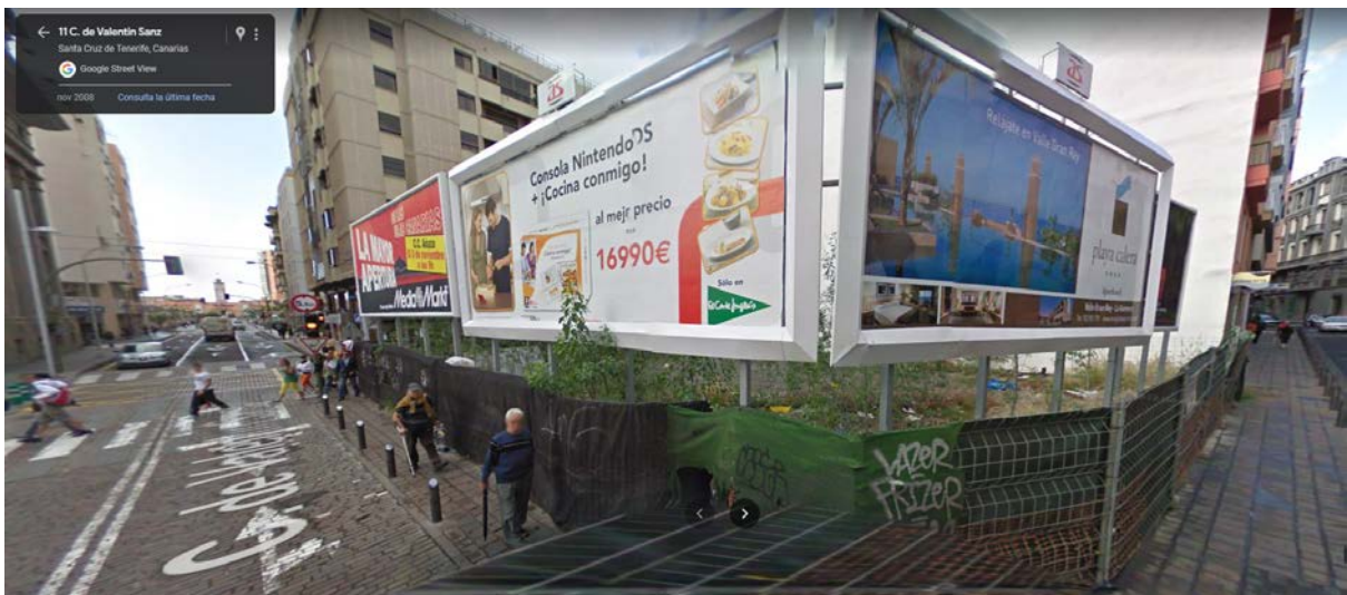
Foto Noviembre de 2008