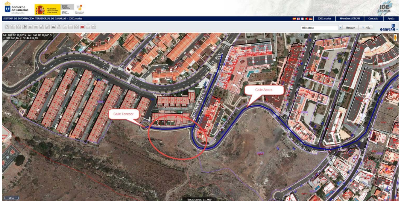
IMAGEN GENERAL DEL ÁMBITO