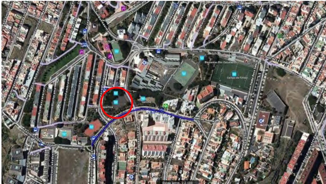
IMAGEN GENERAL DEL ÁMBITO

La propuesta solicitada es viable dentro del marco de los Presupuestos Participativos 2019-2020.