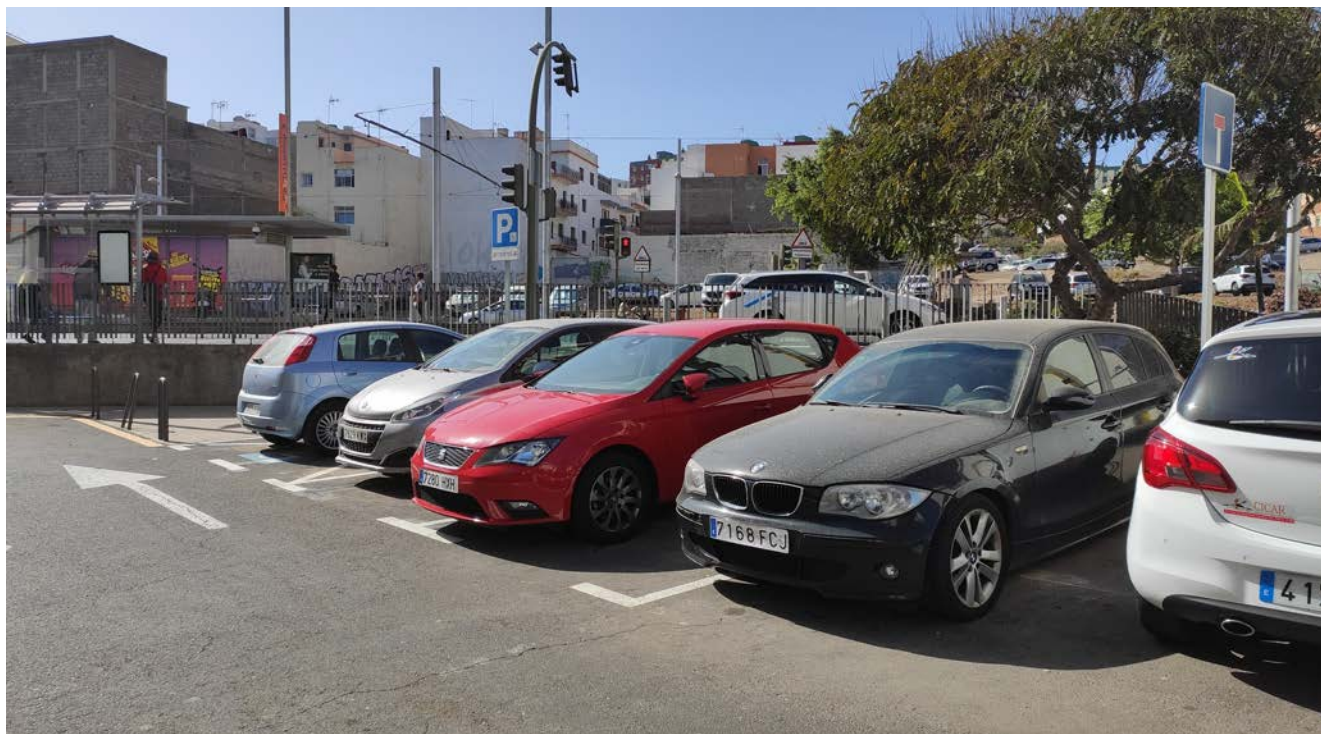
IMAGEN GENERAL DEL ÁMBITO