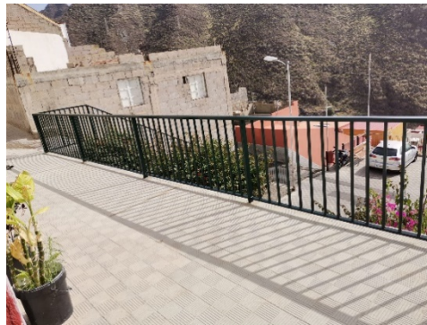
Fotos 4, 5 y 6. Calle Ramón Botas, Barrio Valleseco.