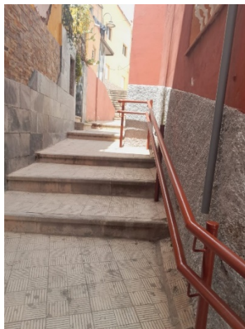
Fotos 11, 12, 13 y 14. Calle Goleta