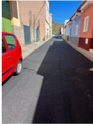
Fotos 7 y 8. Calle Rafaela Gonzalez Rojas.