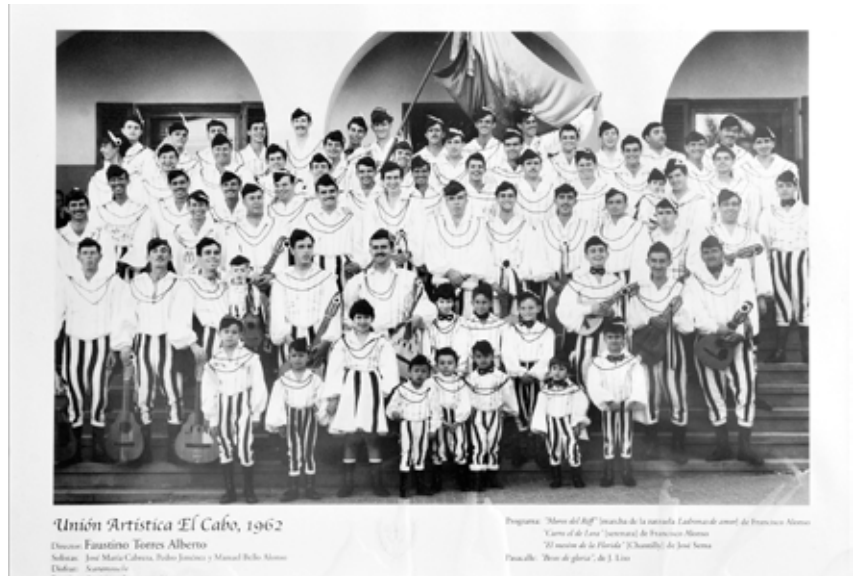
'Unión Artística El Cabo, 1962'

El edil informó que el público que visite esta exposición “podrá comprobar la amplia y fructífera trayectoria de esta rondalla, que forma parte de la historia de la ciudad y muy especialmente de los