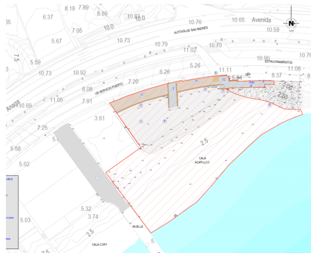
Ámbito terrestre Playa Acapulco